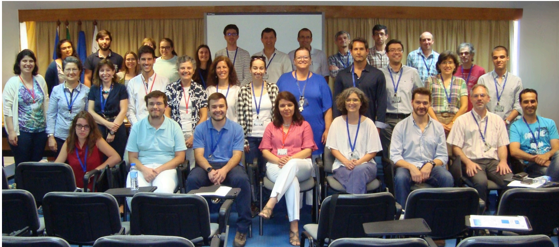
Foto de grupo da segunda edição do Workshop Matemática na UMa.

A segunda edição realizou-se a 12 de junho de 2017 e teve como tema “A Matemática e as Outras Ciências, as Outras Ciências e a Matemática”. Assim, durante todo este dia, foi possível explorar a ligação da Matemática a outras Ciências e vice-versa, através da apresentação de comunicações orais de matemáticos, bem como de autores de outras áreas científicas. Além disso, a diversidade de temas apresentados fez com que este workshop fosse validado pela Secretaria Regional da Educação, para efeitos de progressão na carreira dos docentes de vários grupos de recrutamento.