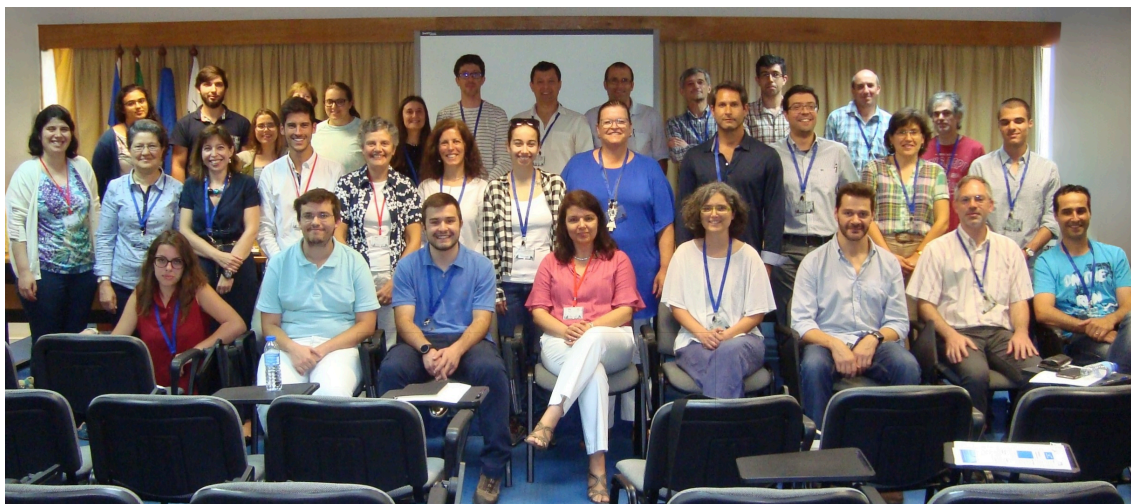
Foto de grupo da segunda edição do Workshop Matemática na UMa.

A segunda edição realizou-se a 12 de junho de 2017 e teve como tema “A Matemática e as Outras Ciências, as Outras Ciências e a Matemática”. Assim, durante todo este dia, foi possível explorar a ligação da Matemática a outras Ciências e vice-versa, através da apresentação de comunicações orais de matemáticos, bem como de autores de outras áreas científicas. Além disso, a diversidade de temas apresentados fez com que este workshop fosse validado pela Secretaria Regional da Educação, para efeitos de progressão na carreira dos docentes de vários grupos de recrutamento.